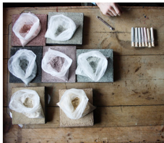
Pigments d'Engiadina da differentas culurs