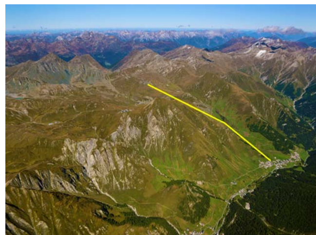
Visualisaziun da la lingia da la telecabina planisada a Samignun.