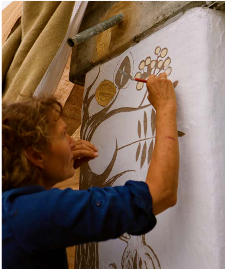
Üna artista a sgrafiar ils motifs.