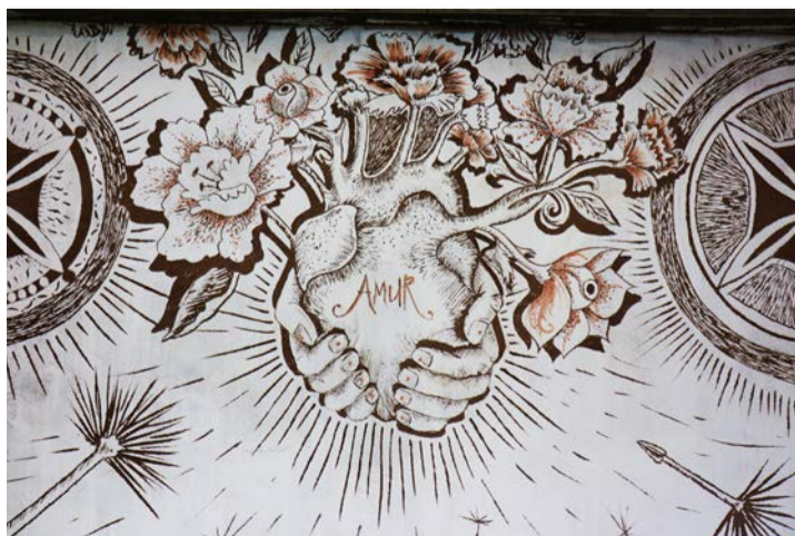
Ün dals sgrafits suot la Baselgia San Geer a Scuol, chi'd es gnü realisà dals 54 mans dal lavuratori internaziunal suot l'instrucziun da Joanes Wetzel .