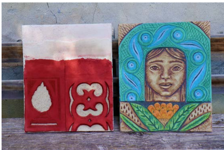
Doos tecnicas similas al sgrafit: a schneistra da la Spogna ed a dretta ün murales da l'Argentina.

A Samignun po gnir fabricada la nuva telecabina da desch per sunas chi colliia il cumün cul territori da skis. Tenor üna comunicaziun da quista gövgia ha la regenza grischuna dat glüm verda al nov implant turistic «Laret – Champs – Muller». I'l rom da quist proget sessan plünavant gnir adattadas vias agriculas, vias da spassegiar e dad ir cun bike, sco eir las loipas per far passlung. (cdm/rtr/fmr)